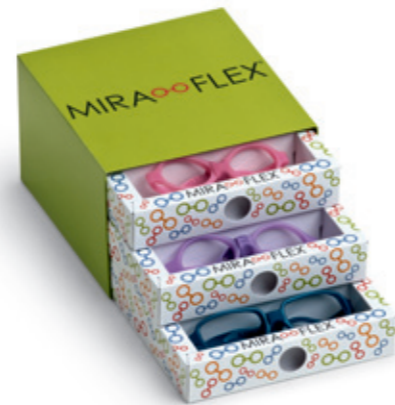
8600 04 9er Präsentationsbox (ohne Inhalt)