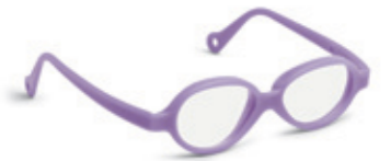
8624 04 | purple