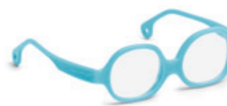
8612 09 | blue