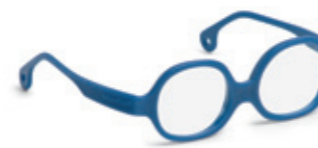
8612 06 | dark blue