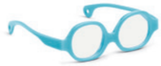
8610 09 | blue