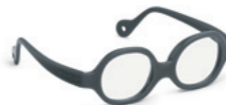
8611 13 | dark grey