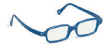
8631 07 | dark blue pearl