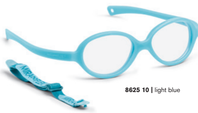
8625 10 | light blue