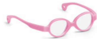
8620 01 | pink