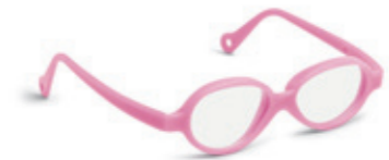
8624 01 | pink