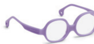
8612 04 | purple