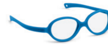
8625 05 | royal blue