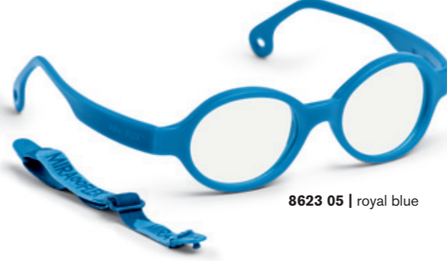
8623 05 | royal blue