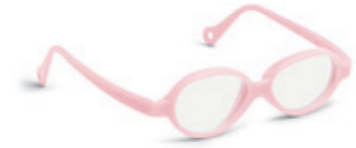
8624 02 | light pink