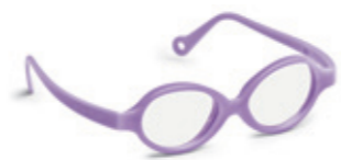
8621 04 | purple