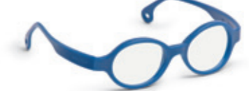
8623 06 | dark blue