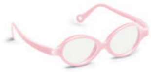
8621 03 | light pink pearl