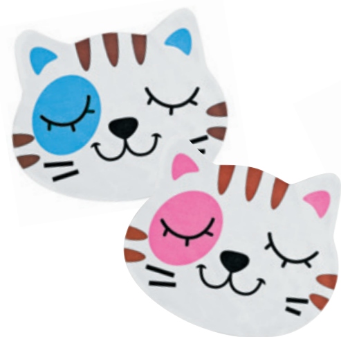
8600 02 Mikrofasertuch blau, 10 St. 8600 03 Mikrofasertuch rosa, 10 St.