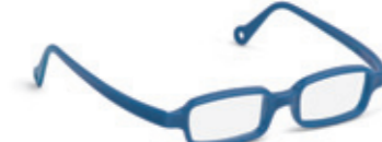
8630 06 | dark blue