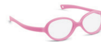
8625 01 | pink