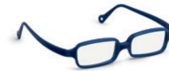
8632 08 | navy blue