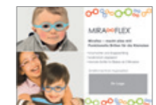
Zum Download Anzeigenvorlage für Ihre Werbung in den Medien