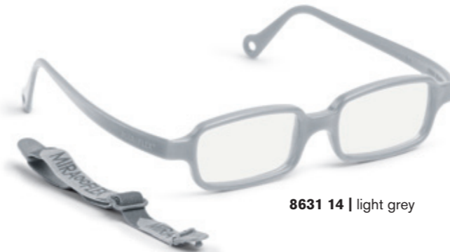
8631 14 | light grey