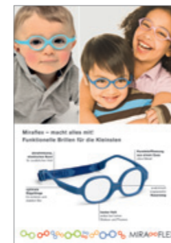
8600 08 Poster, 297 x 420 mm (erhältlich ab 6 Fassungen)