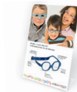
Zum Download Dekoaufsteller, 210 x 297 mm