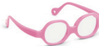
8611 01 | pink