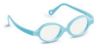
8621 10 | light blue