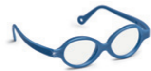
8621 07 | dark blue pearl