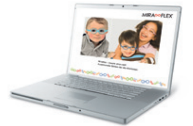
Zum Download Powerpoint-Präsentation für Ihre Kundenberatung oder zur Vorstellung von Miraflex z.B. in Kindergärten, bei Verbänden oder Orthoptistinnen