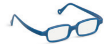
8631 06 | dark blue