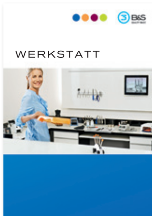
• Werkstattartikel Brillenteile