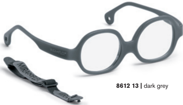
8612 13 | dark grey