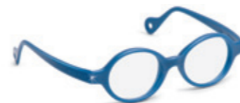
8622 07 | dark blue pearl