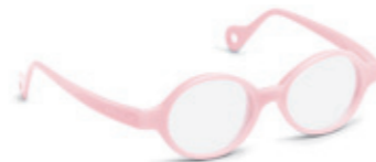
8622 02 | light pink