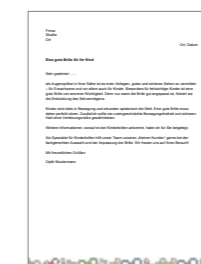
Zum Download Anschreibenvorlage für gezielte Versandaktionen an Ihre Kunden