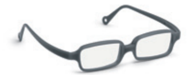
8632 13 | dark grey