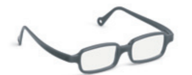
8631 13 | dark grey