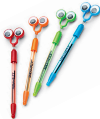
8600 06 Kugelschreiber farbsortiert, 4 St.