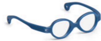
8620 07 | dark blue pearl