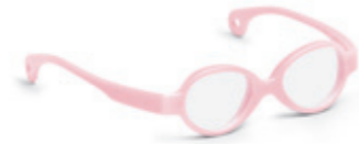
8620 02 | light pink