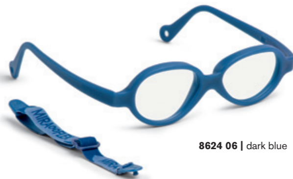
8624 06 | dark blue