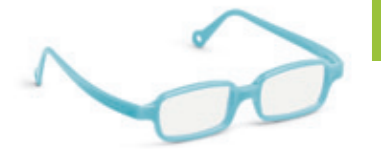
8631 10 | light blue