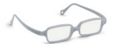
8632 14 | light grey