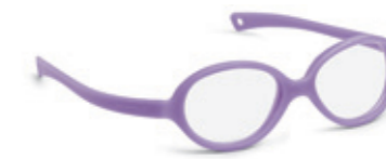
8625 04 | purple