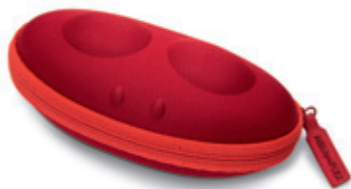
8600 01 Brillenetui, rot