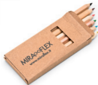
8600 07 Buntstifte farbsortiert, 6 St.