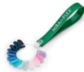
8600 05 Farbfächer, zeigt alle 14 verfügbaren Fassungsfarben