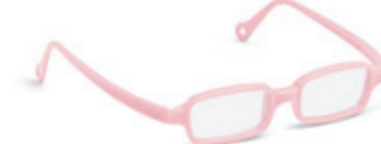
8630 02 | light pink