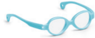
8620 11 | light blue pearl