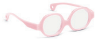
8610 02 | light pink