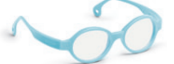
8623 10 | light blue