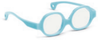
8610 10 | light blue