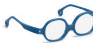
8612 07 | dark blue pearl