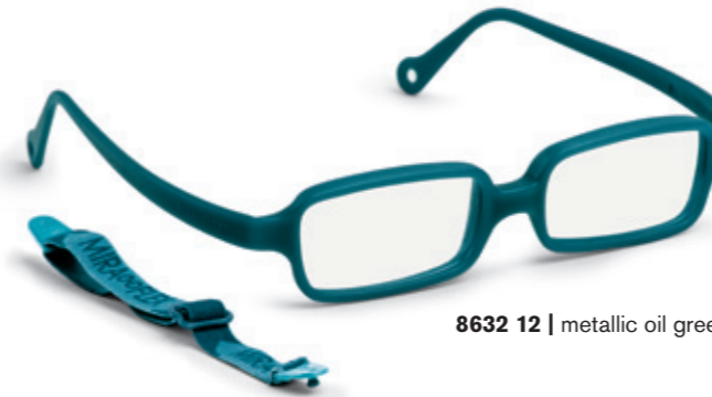
8632 12 | metallic oil green