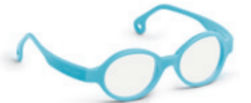
8623 09 | blue