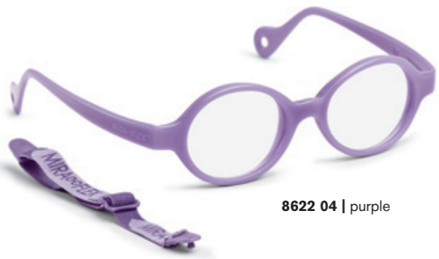
8622 04 | purple