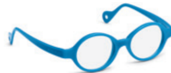
8622 05 | royal blue