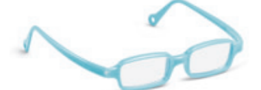
8630 11 | light blue pearl