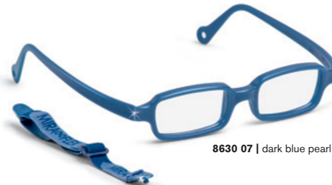
8630 07 | dark blue pearl