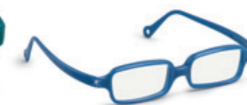
8632 07 | dark blue pearl