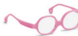
8612 01 | pink