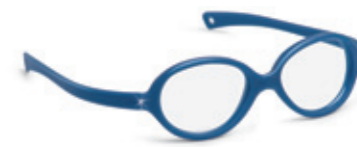
8625 07 | dark blue pearl