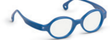
8623 07 | dark blue pearl