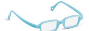
8630 10 | light blue