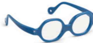
8611 07 | dark blue pearl