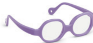
8611 04 | purple