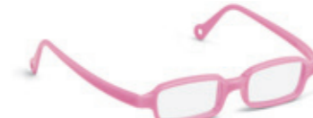
8630 01 | pink