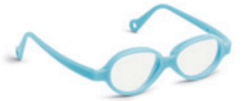
8624 10 | light blue