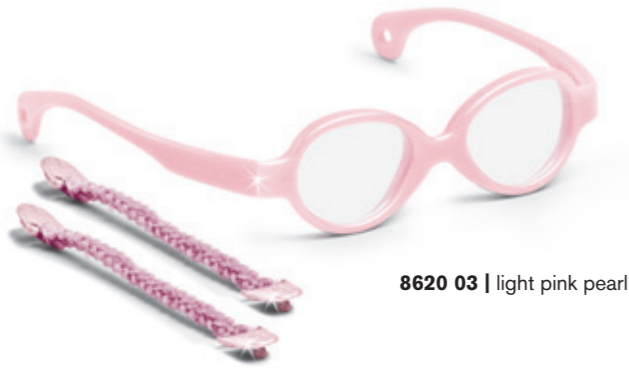
8620 03 | light pink pearl