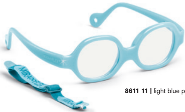
8611 11 | light blue pearl