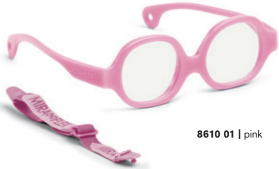
8610 01 | pink