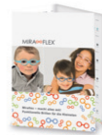
8600 09 Kundenflyer, 148 x 210 mm (erhältlich ab 6 Fassungen)