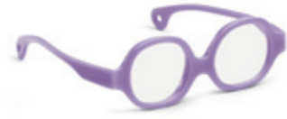
8610 04 | purple