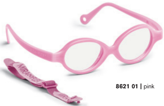
8621 01 | pink