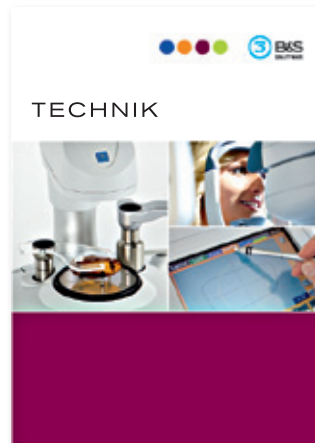
• Glasbearbeitung Refraktion