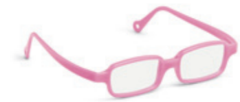
8631 01 | pink