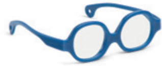
8610 06 | dark blue