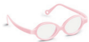
8621 02 | light pink