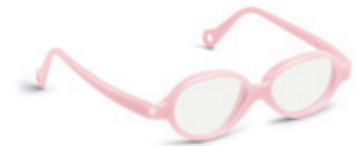
8624 03 | light pink pearl